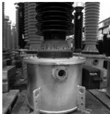
ES/ Indicador de nivel EN/ Oil level indicator PT/ Indicador de nível FR/ Indicateur de niveau DE/ Ölstandanzeig

DE/ Die kapazitiven Spannungswandler setzen sich aus einer oder mehr Kondensatoreinheiten zusammen und sind oberhalb des Beckens an der Stelle montiert, an der sich die elektromagnetische Einheit befindet (Zwischentransformator, Kompensationsspule, sowie weitere Hilfselemente). Das Becken ist mit einem Gehäuse verbunden, in dem sich die Sekundäranschlussstücke und die Kompensationen befinden (letztere werden von einer verplombten Schutzhaube verdeckt).